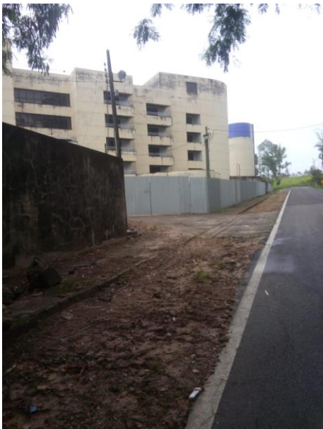
F 07 – AV. CELINA FALCÃO ANDRADE