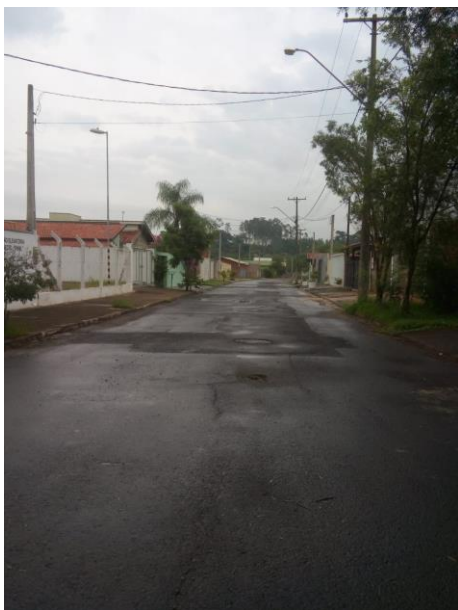
F 03 — RUA OSVALDO MARIA BARBOSA