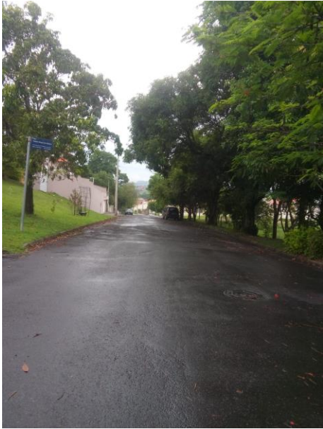
F 05 – RUA ALBANO BISPO DOS SANTOS