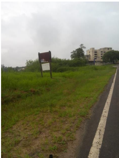
F 09 — AVENIDA CELINA FALCÃO ANDRADE