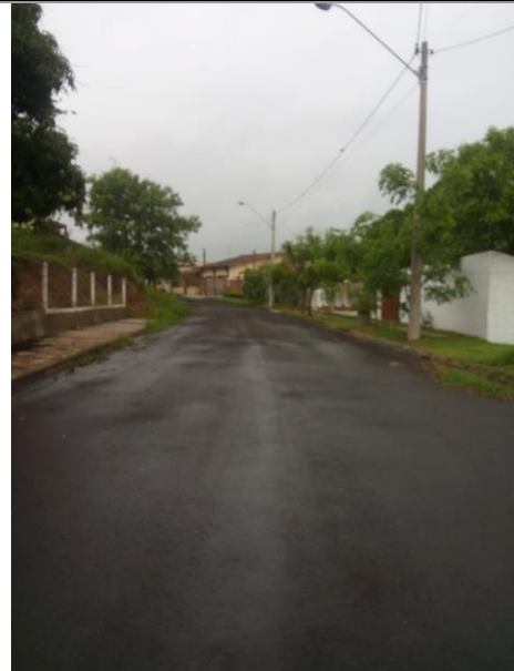
F 02 — RUA AMÉLIO SCARANELLO PIRES