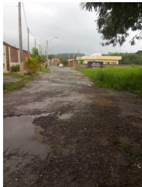
F 04 — RUA OSVALDO MARIA BARBOSA