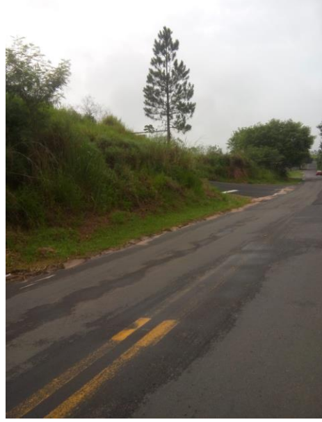
F 08 — AV. CELINA FALCÃO ANDRADE