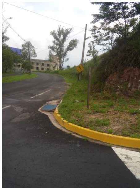
F 10 — AV. CELINA FALCÃO ANDRADE