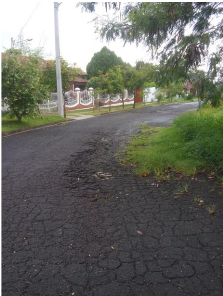
F 01 – RUA AMÉLIO SCARANELLO PIRES